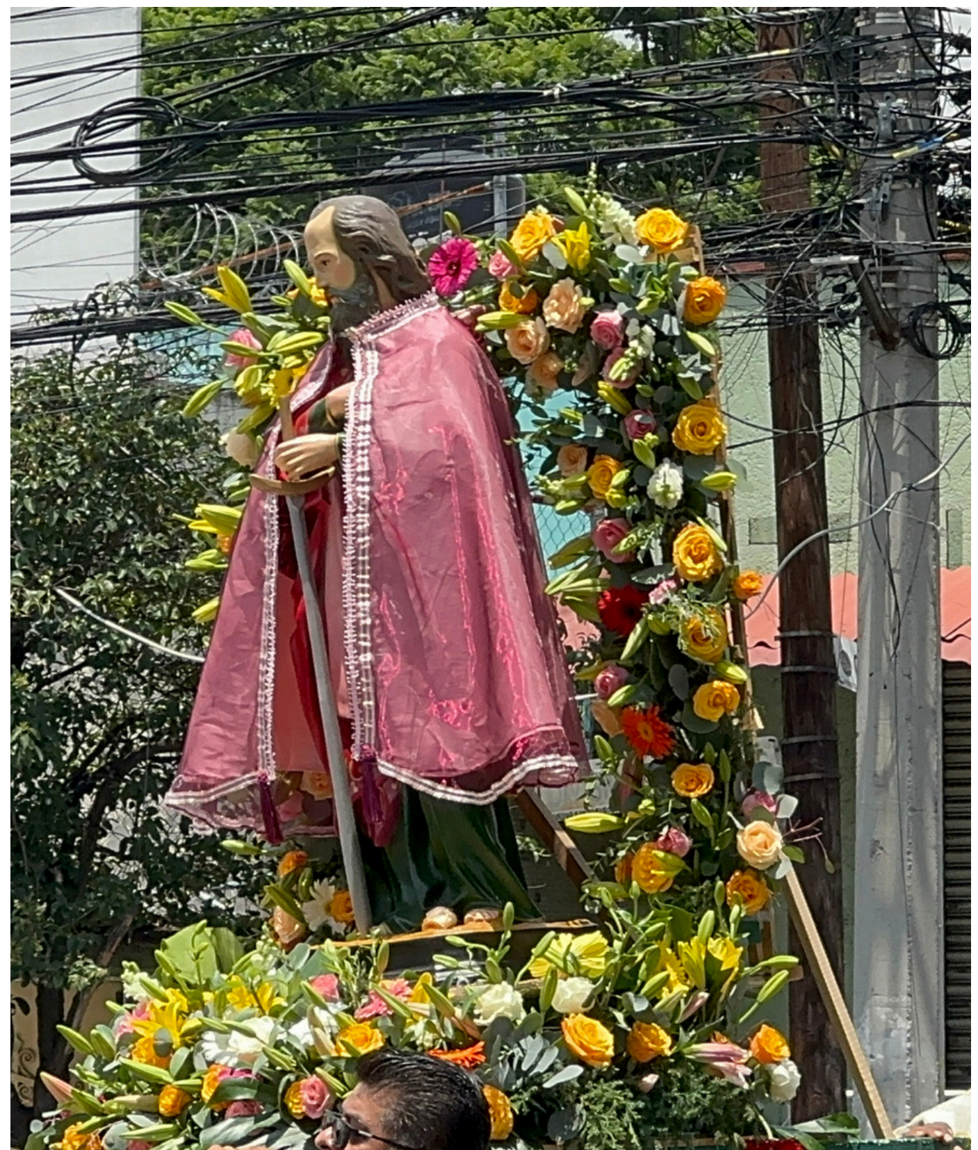
San Pablo en procesión por las calles del pueblo.

Se tiene un sistema de fiestas religioso amplio al igual que muchos pueblos y barrios originarios de Coyoacán reciben al Señor de la Misericordia; en San Pablo Tepetlapa el recibimiento de esta imagen ocurre en julio, regularmente en la segunda semana de este mes.