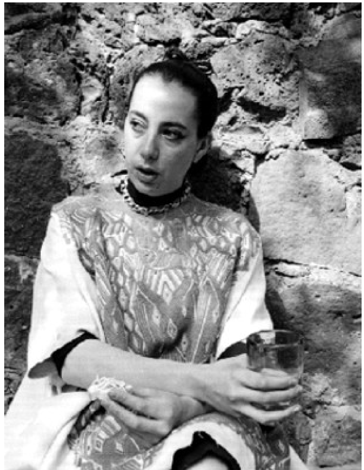
Ruth Rivera Marín

Un dato interesante sobre Ruth Rivera es que fue la primera mujer en ingresar a la Escuela Superior de Ingeniería y Arquitectura (ESIA) del Instituto Politécnico Nacional de México. Su último cargo fue como jefa del Departamento de Arquitectura del Instituto Nacional de Bellas Artes hasta su muerte en 1969.