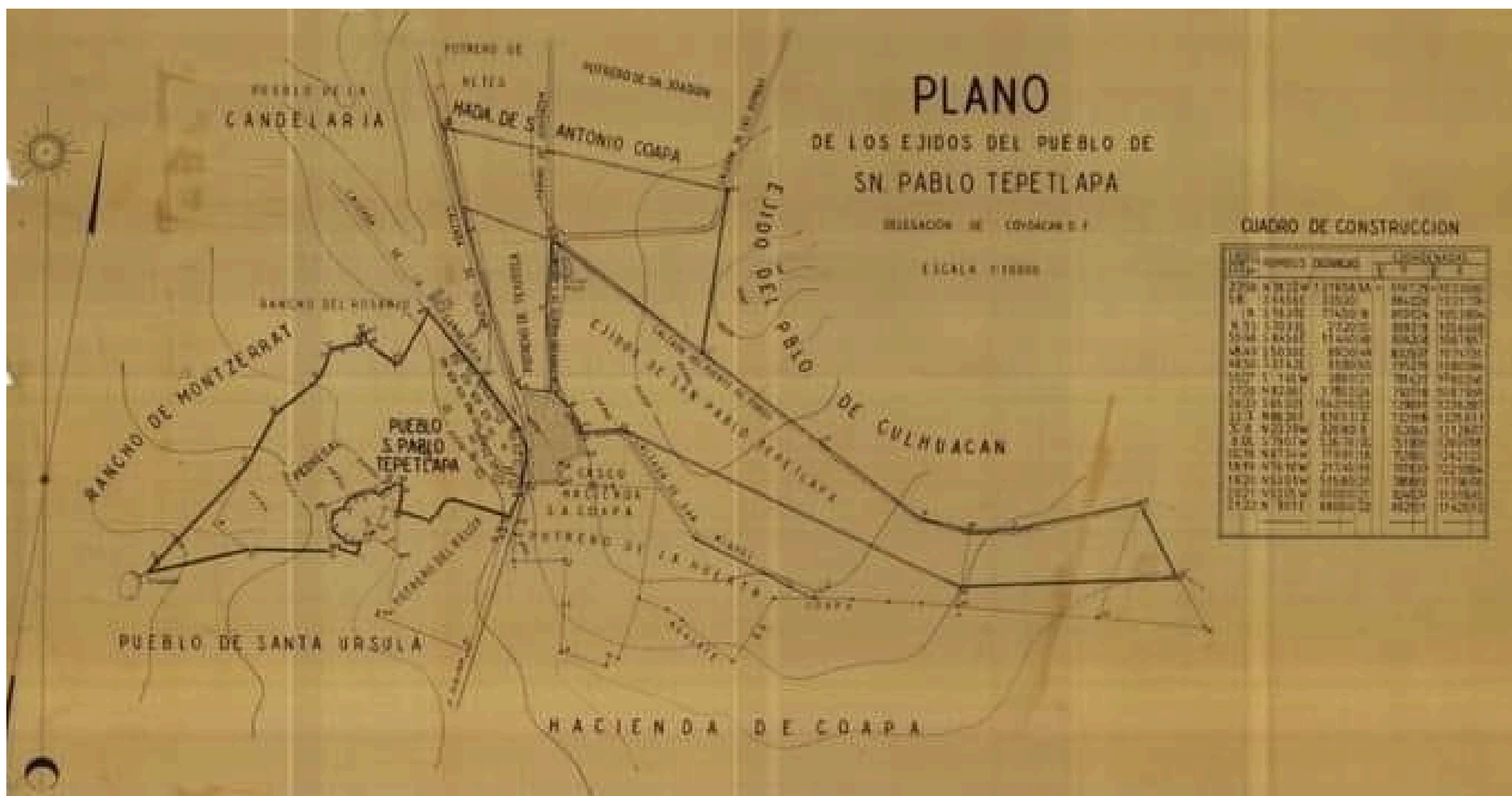
Plano de los ejidos del pueblo de San Pablo Tepetlapa en el siglo XX de R. Olvera

Asimismo, en San Pablo Tepetlapa el vínculo con la tierra ha sido muy fuerte, ya que el territorio se utilizó para actividades agrícolas e incluso ganaderas dando lugar a sitios como la hacienda de San Antonio de Padua Coapa, San José de Coapa y la de San Juan de Dios las cuales formaron parte de la actual zona de Coapa que hoy día comparten las alcaldías Coyoacán y Tlalpan.