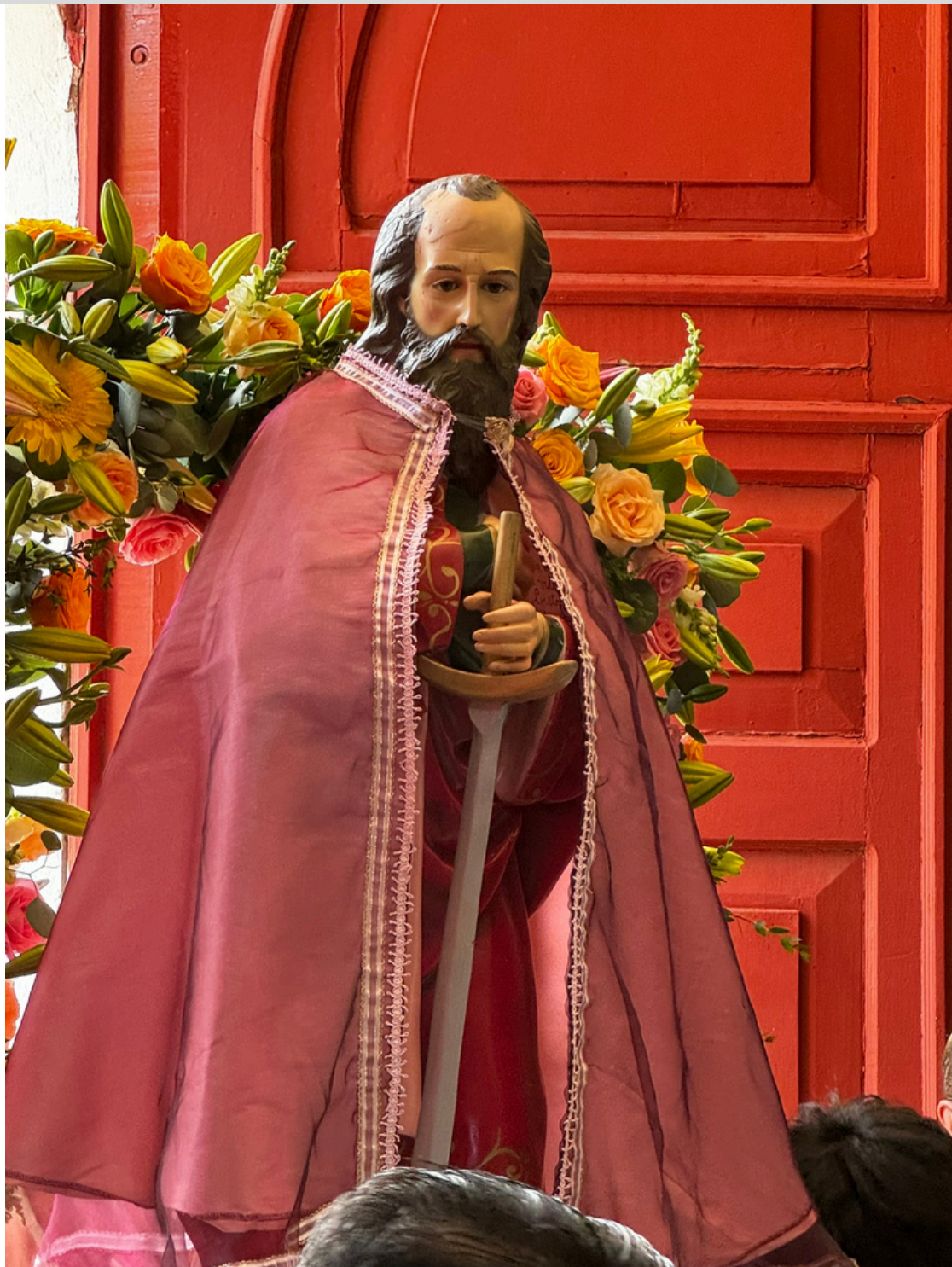
San Pablo entrando a su parroquia