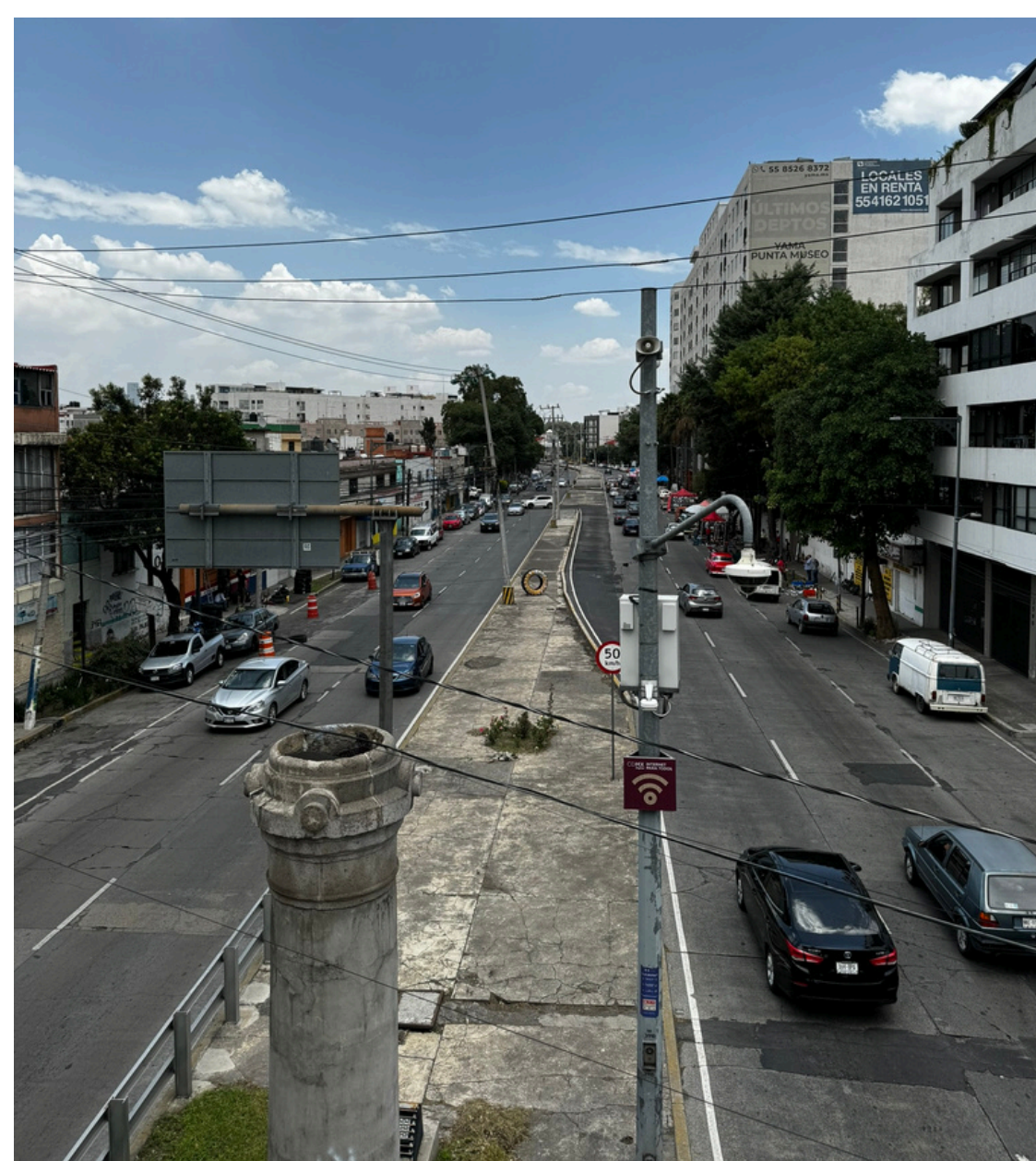
Av. División del Norte

Desde los años 70 ha sufrido transformaciones que han llevado a que el pueblo de San Pablo Tepetlapa se haya fragmentado, dando paso a la creación de colonias como Prados de Coyoacán, Avante, Espartaco, Adolfo Ruíz Cortines y Ajusco.