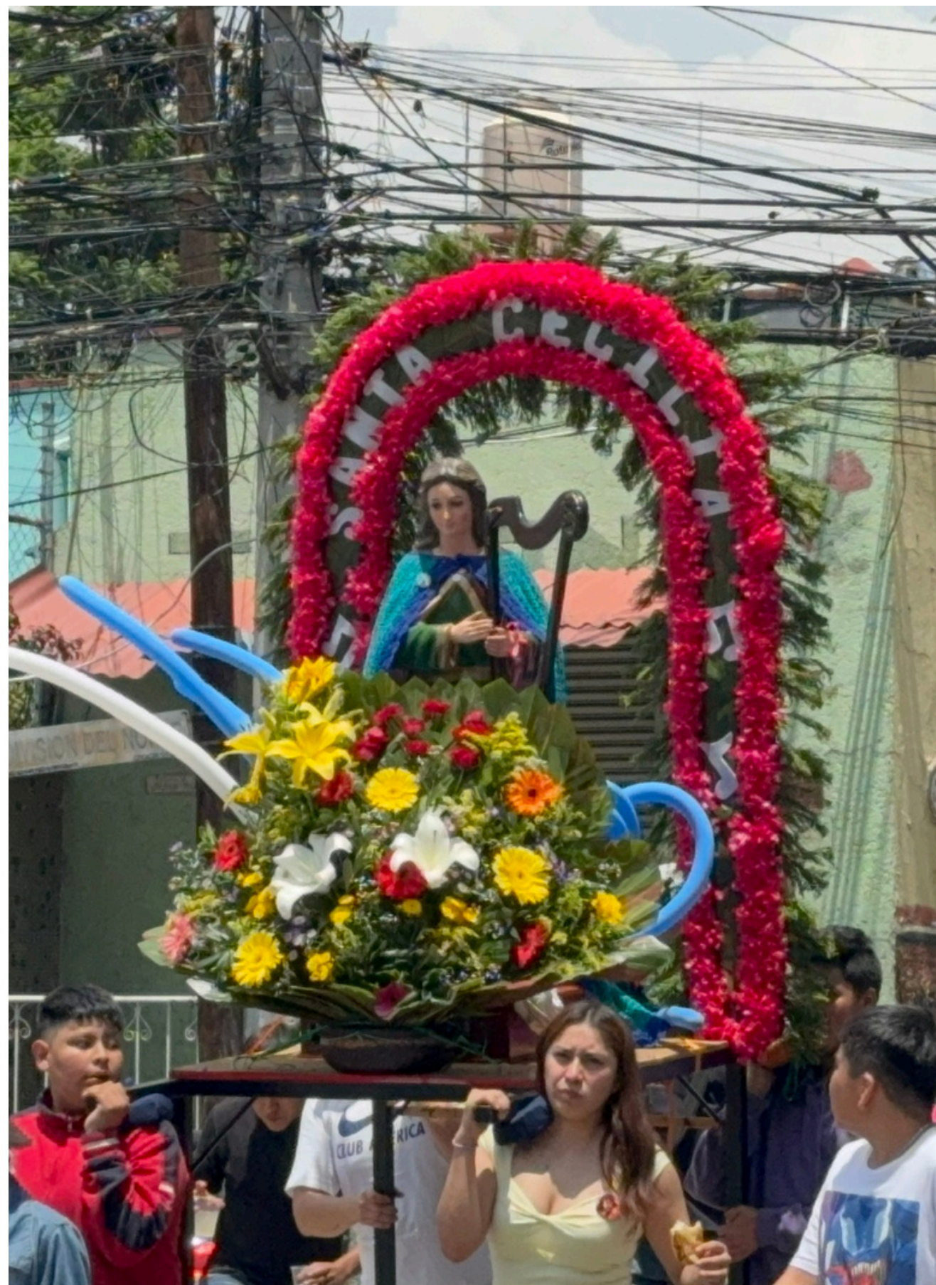
Procesión de Santa Cecilia, patrona de los músicos.

Un dato interesante de todas estas procesiones que ocurren en el pueblo de San Pablo Tepetlapa es que peregrinan por calle Hidalgo y Museo siendo un punto de encuentro frente a la explanada del Museo Anahuacalli.