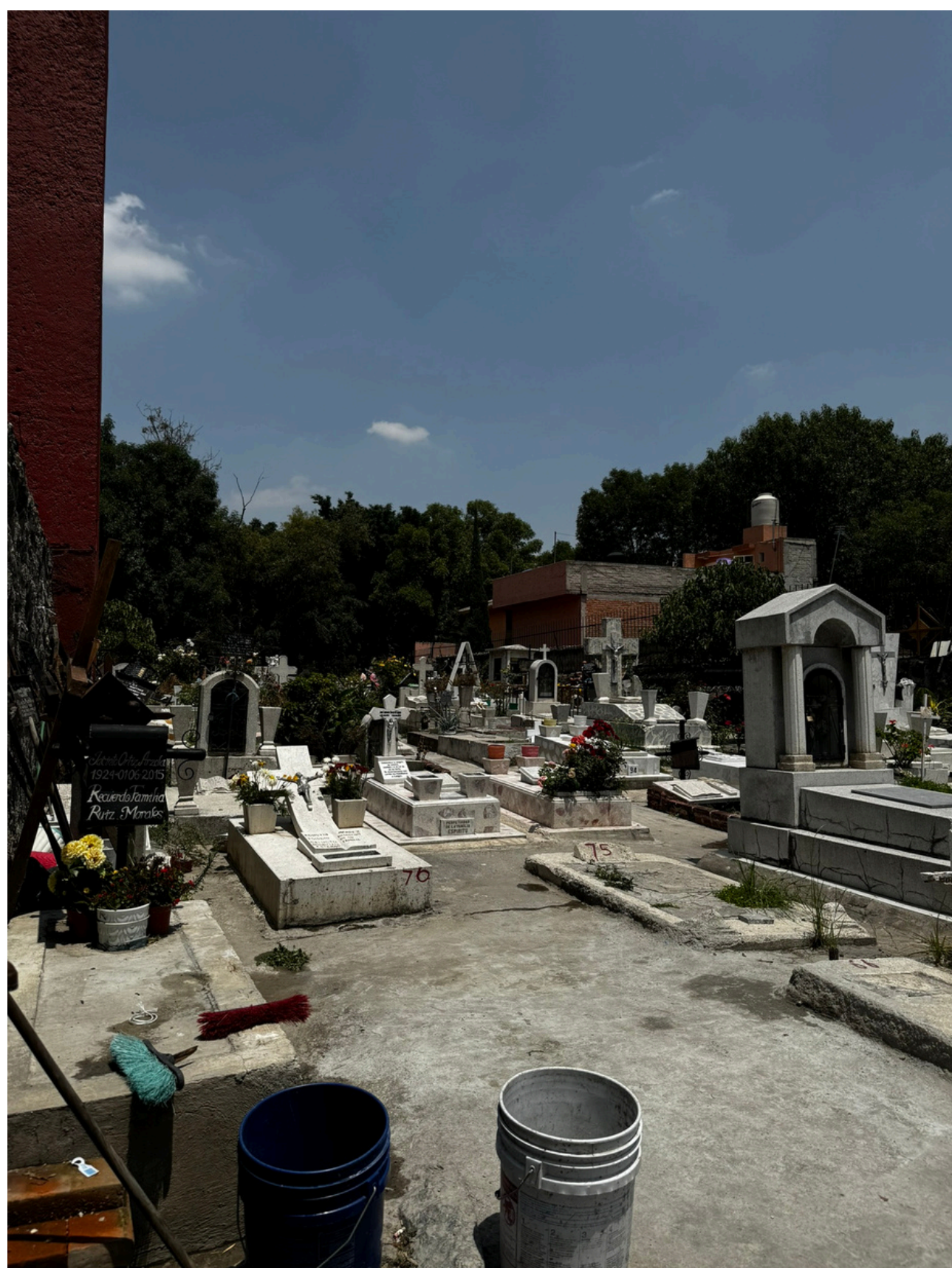
Panteón de San Pablo

De acuerdo con la Congregación del Oratorio de San Felipe Neri de San Pablo Tepetlapa durante la década de 1960 se realizaron obras de remozamiento, aplanado y pintado de las fachadas, y también se construyó la casa parroquial, mientras que en 1968 se acondicionó el presbiterio y el interior, para 1977 se construyó la capilla anexa en ella resalta el vitral con el escudo de esta Congregación.