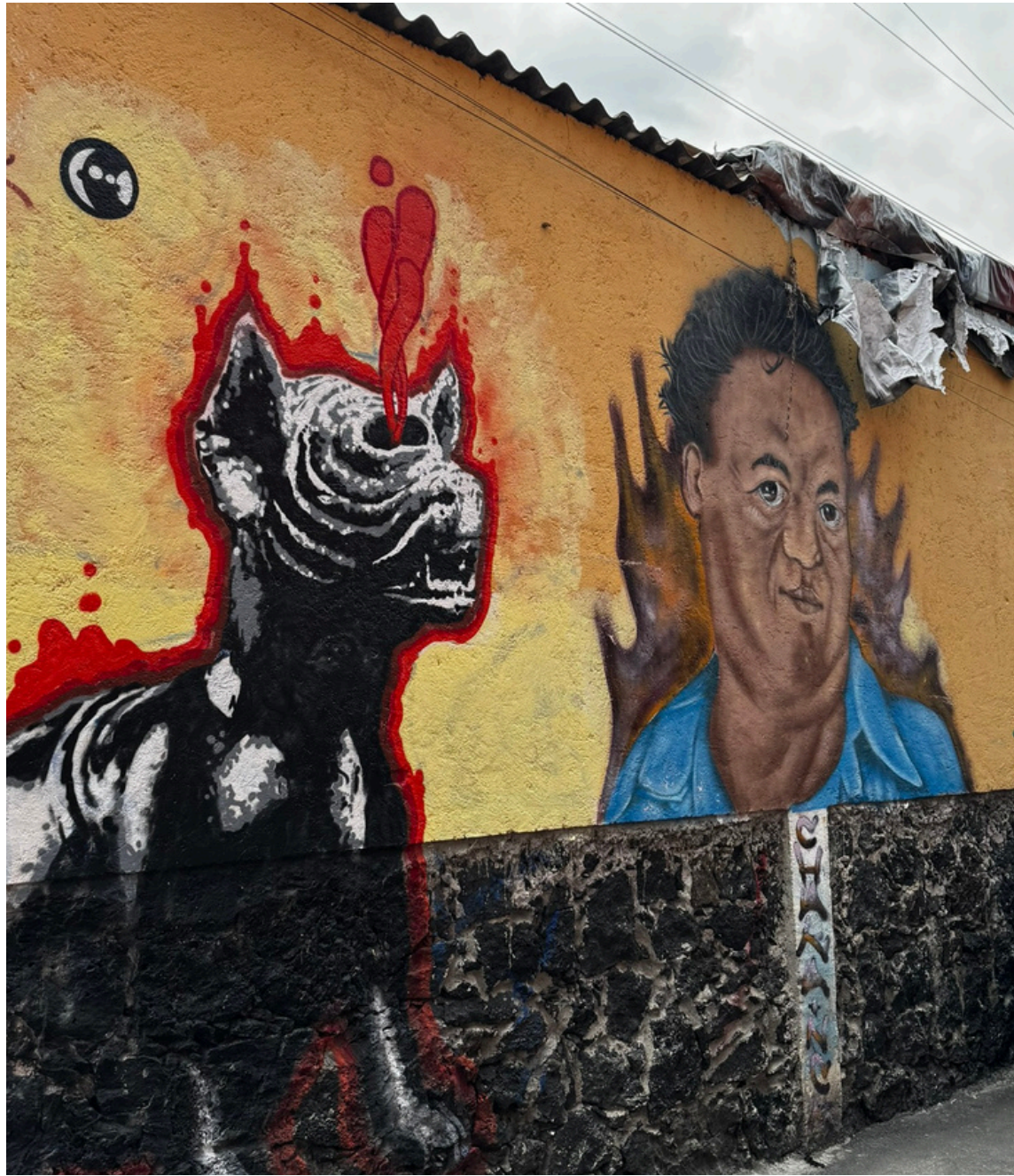
Mural dedicado a Diego Rivera en calle Cuauhtémoc

Pintor de origen guanajuatense, pero de corazón coyoacanense, ya que gran parte de su vida vivió en Coyoacán e incluso algunos años habito la Casa Azul junto con Frida Kahlo. Diego Rieva es uno de los exponentes del muralismo mexicano más reconocidos durante el siglo XX parte de su legado permanece en el pueblo de San Pablo Tepetlapa.