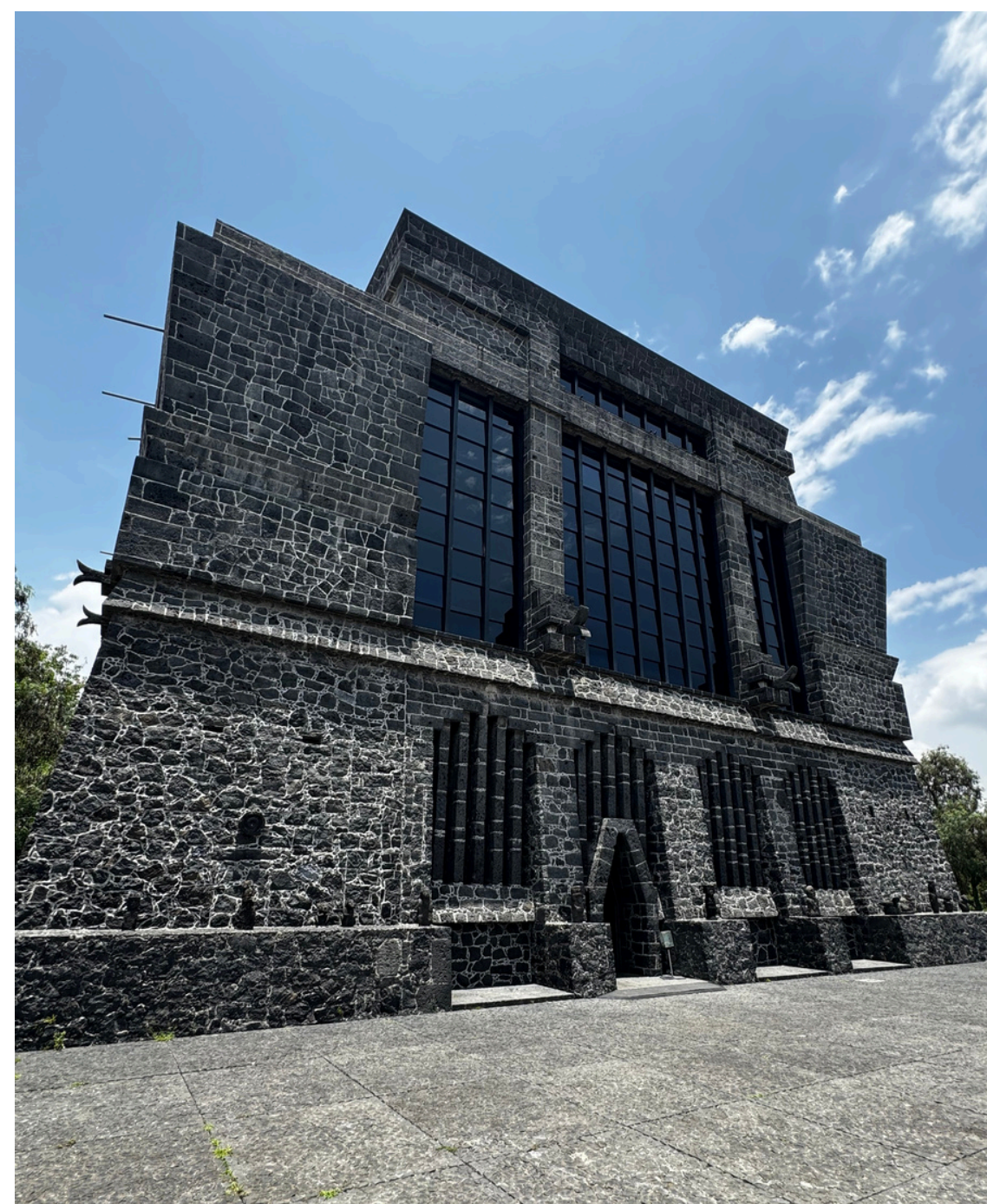
Fachada del Museo Anahuacalli

Este museo alberga la colección de piezas prehispanicas y bocetos de murales de Diego Rivera, la idea del muralista era crear “un complejo integrado para el desarrollo de las artes, donde se desarrollaran eventos de teatro, danza, pintura, música, etc. todo ello integrado a un entorno natural” (Sada, 2016).