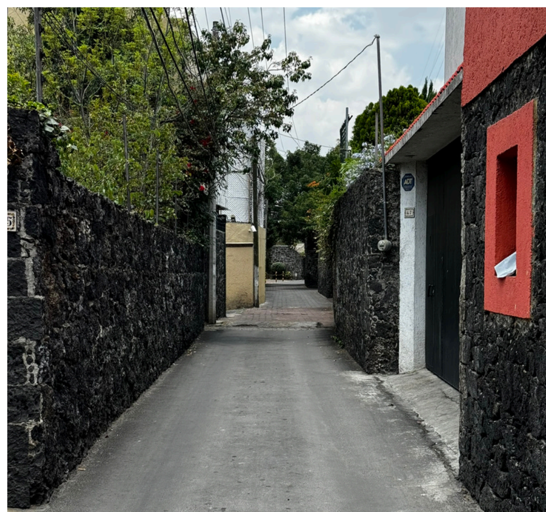
Vista de la calle Moctezuma