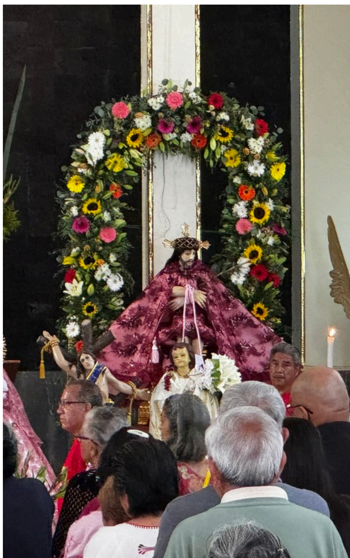
Recibimiento del Sr. de la Misericordia en San Pablo Tepetlapa

La festividad mayor es el 25 de enero en honor a San Pablo Apóstol santo patrón del pueblo. En esa festividad, no puede faltar el recorrido de la imagen del santo patrono por las calles del pueblo acompañado de las ráfagas de cohetes el tambor y trompetas de la banda, los danzantes con el ya tradicional salto del chinelo, a todo esto se suman las porras de los peregrinos en honor a San Pablo Apóstol.