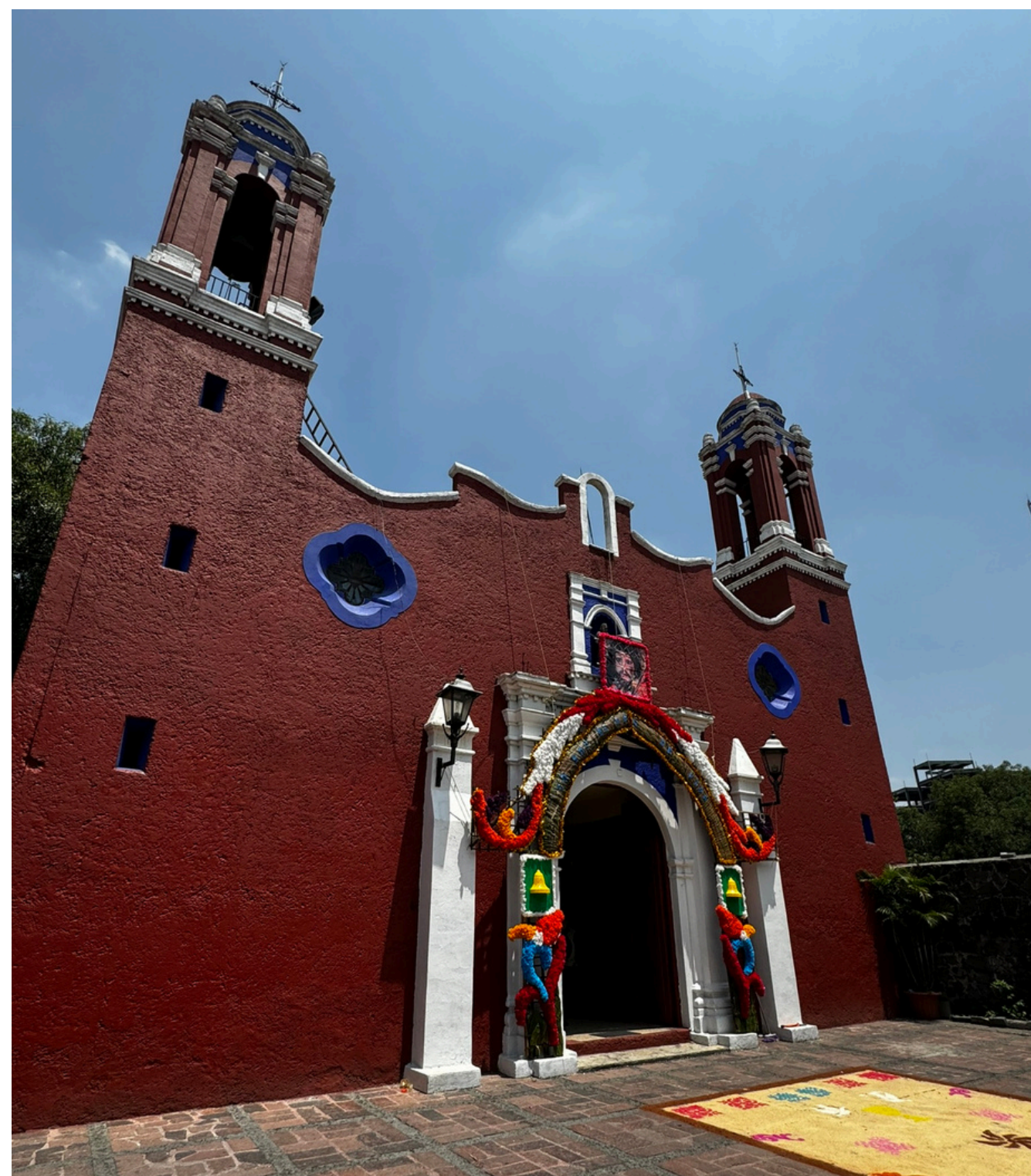
Parroquia de San Pablo apóstol

Su primera capilla data de 1580 y era abierta construida con rocas volcánicas, para 1881 se reconstruyó junto con una torre de campanario que prevalece y durante 1945 se amplió el templo hacia el frente con una portada y dos torres para mantener el estilo de la parte que fue demolida.