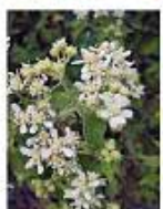
Zoapatle ( Montanoa tomentosa ) Planta nativa.