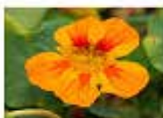
Mastuerzo ( Tropaeolum majus ) Esta planta es de bajo mantenimiento y atrae mariposas blancas, solo necesita riego cada tercer día y mucho sol.