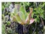
Tememetla ( Echeveria gibbiflora )