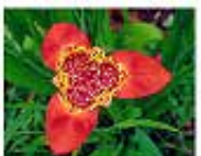
Oceloxochitl ( Tigridia pavonia ) Flor de temporara, se recomienda poner bulbos para que florezca en la temporada correspondiente.