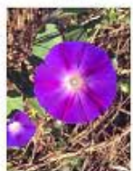
Campanilla morada ( Ipomoea purpurea )