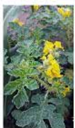
Ayohuiztle ( Solanum rostratum )