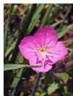
Hierba del golpe ( Oenothera rosea )