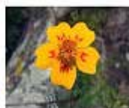
Cinco llagas / cempasúchil ( Tagetes lunulata ) Esta planta es de temporada de día de muertos, se recomienda dispersar semillas en los taludes para que aparezca en esta temporada.