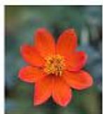
Dalia Roja ( Dahlia coccinea )