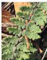
Helecho dorado ( Myriopteris aurea ) Planta de bajo mantenimiento recomendada para taludes.