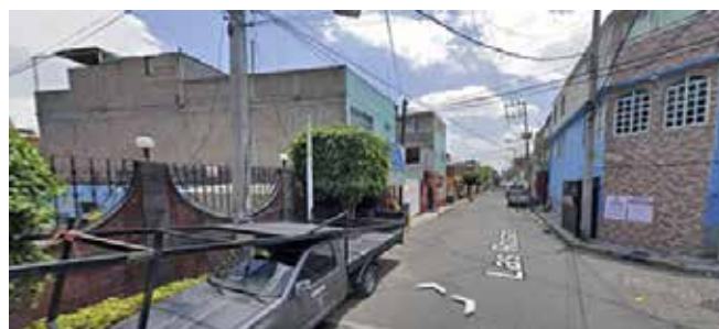
Larguillo de fachadas del lado derecho