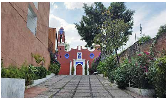
Templo, capilla, parroquia y atrio