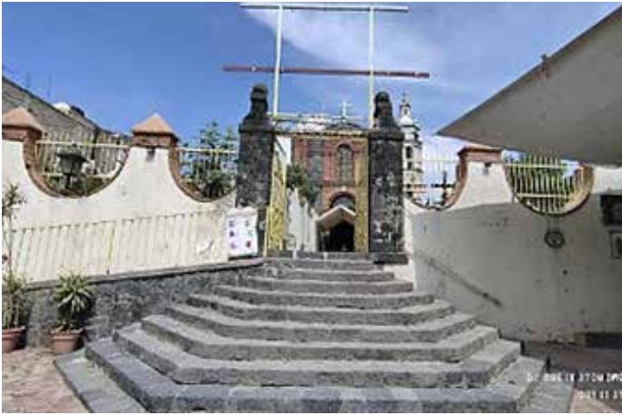
Templo, capilla y parroquia