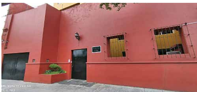
Larguillo de fachadas del lado izquierdo