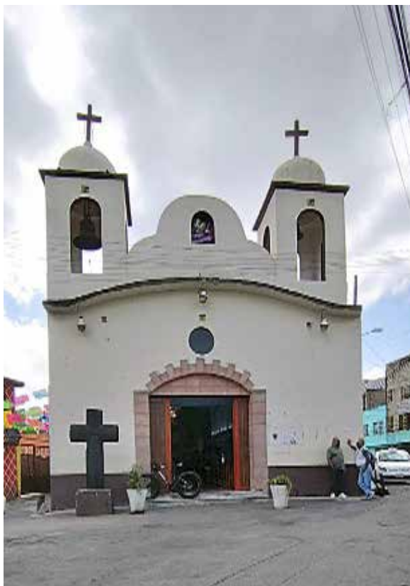
Parroquia y Capilla