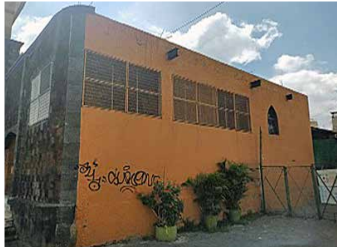
Larguillo de fachadas del lado derecho

Sus características arquitectónicas refieren su construcción al siglo XIX. El altar recubierto con losas de granito y el piso de mosaico son de factura reciente, al igual que un templo moderno adosado a esta capilla.