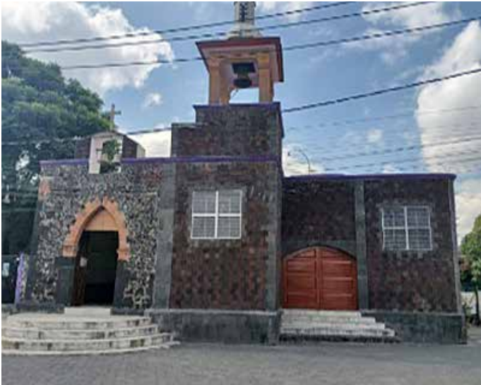
Templo, capilla, parroquia y atrio