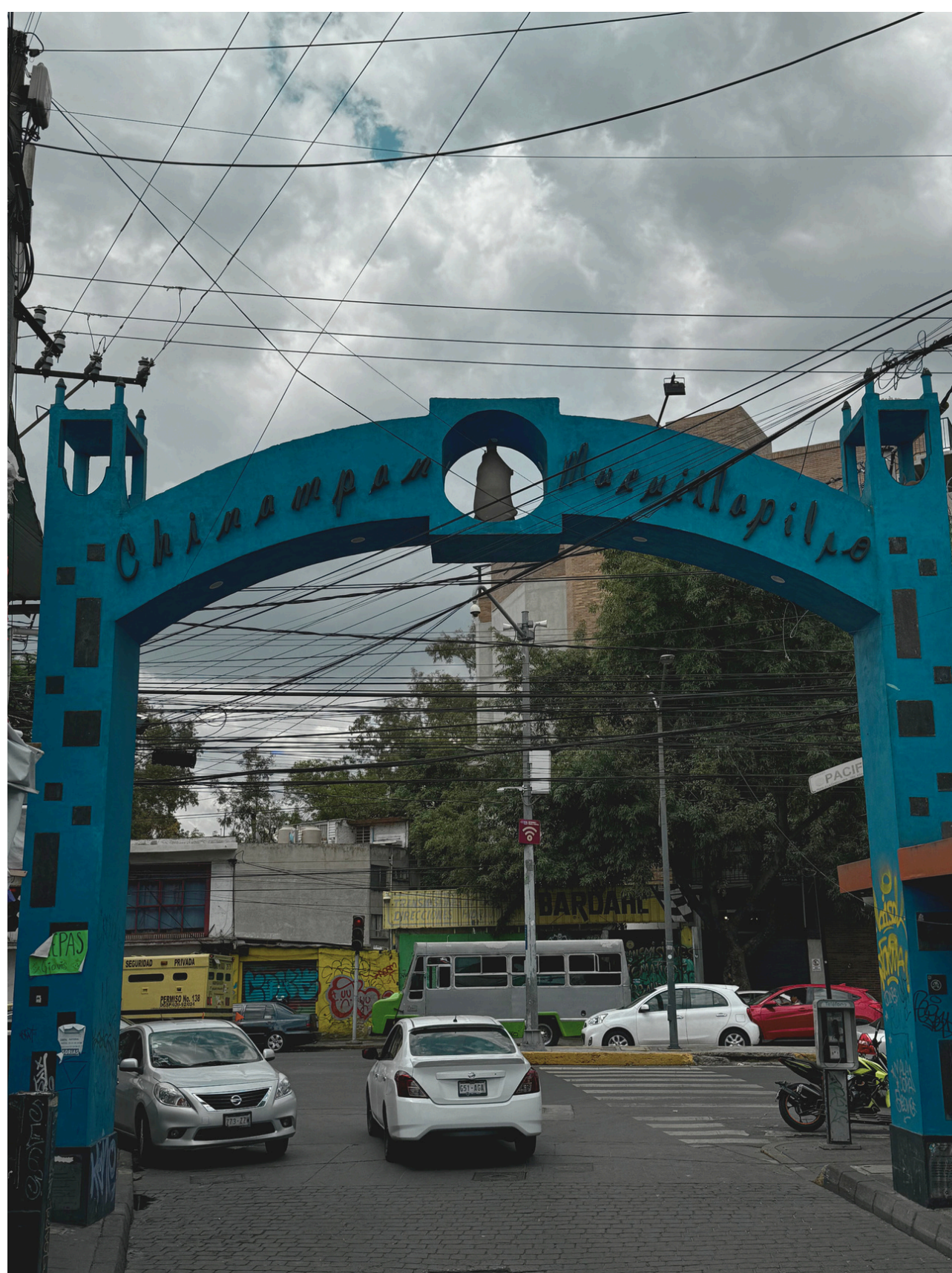
Arco de bienvenida al Pueblo de la Candelaria

La conformación social de los pueblos y barrios originarios en Ciudad de México es muy particular, ya que los lazos familiares aún se conservan por la permanencia de algunas familias originarias que llevan más de un siglo habitando estos territorios, de tal manera que su vínculo con su pueblo o barrio se mantiene consolidado por sus festividades, la propiedad de la tierra, así como el vínculo con sus antepasados que algunos de ellos se encuentran enterrados en los panteones de los pueblos.