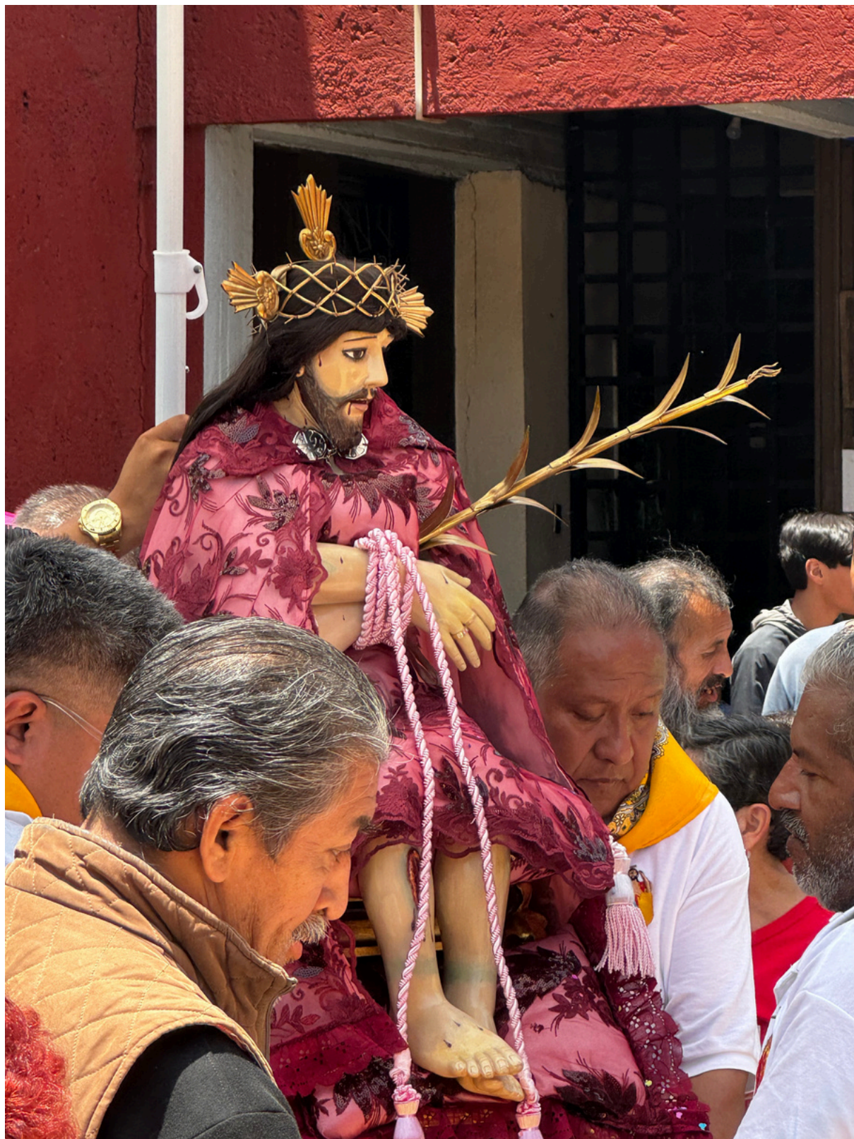
Señor de la Misericordia en procesión

En La Candelaria se recibe dos veces al Señor de la Misericordia. La primera coincide con la fiesta de San Juan Bautista entre el 24 de junio al 9 de julio, posteriormente reciben la imagen del Señor de la Misericordia a finales de agosto para que el primer domingo de septiembre regrese la imagen del santo patrón de Coyoacán al pueblo de Los Reyes.