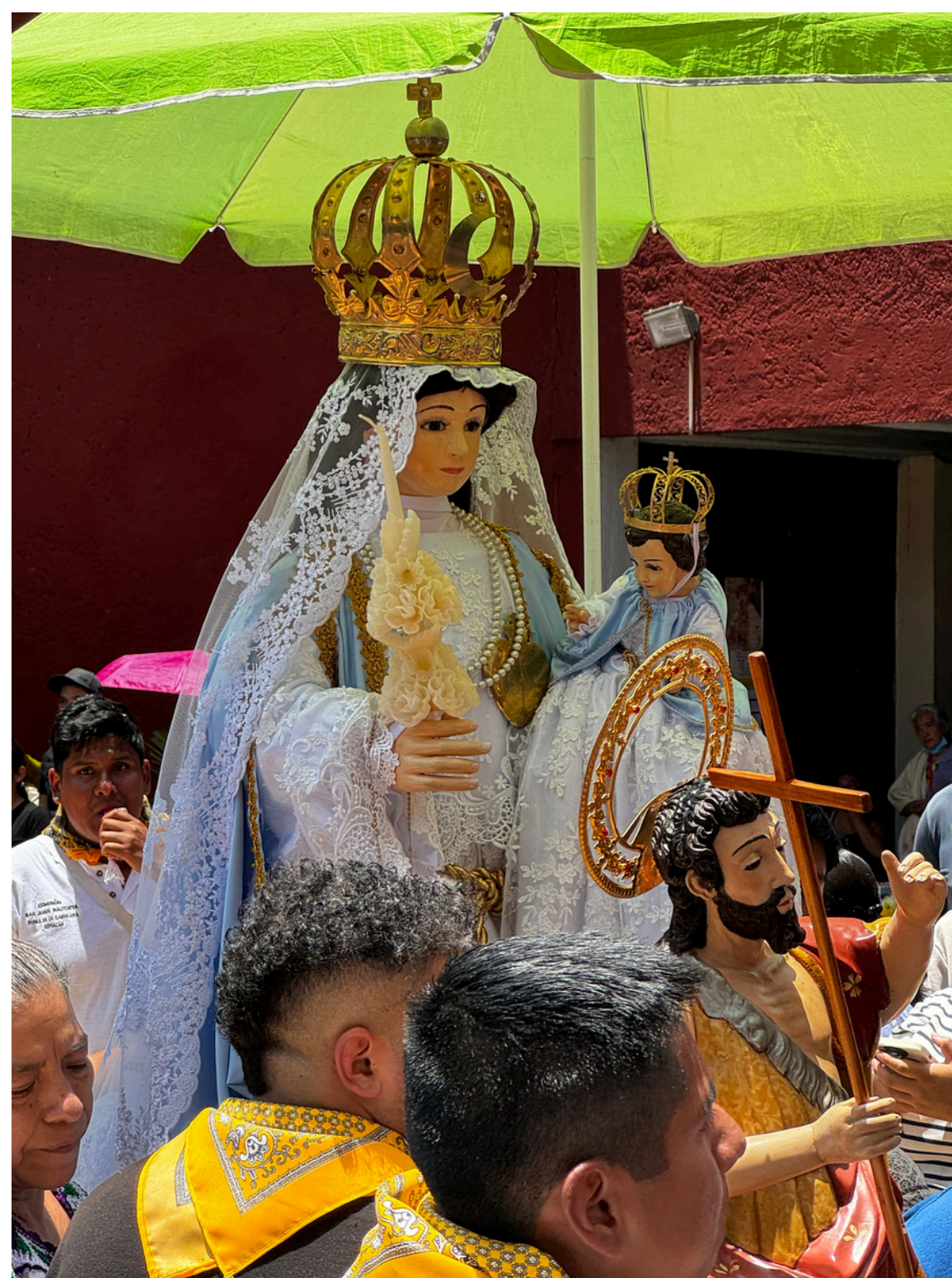
Virgen de la Candelaria en procesión por las calles del pueblo

En esta fiesta del dos de febrero se pueden ver los tradicionales tapetes de aserrín, escuchar las mañanitas y acudir a misa en la parroquia de la Purificación de Nuestra Señora de La Candelaria donde los feligreses llevan a bendecir su Niño Dios. Tampoco puede faltar la verbena popular con los puestos de comida, juegos mecánicos, la quema de castillos pirotécnicos y toritos.