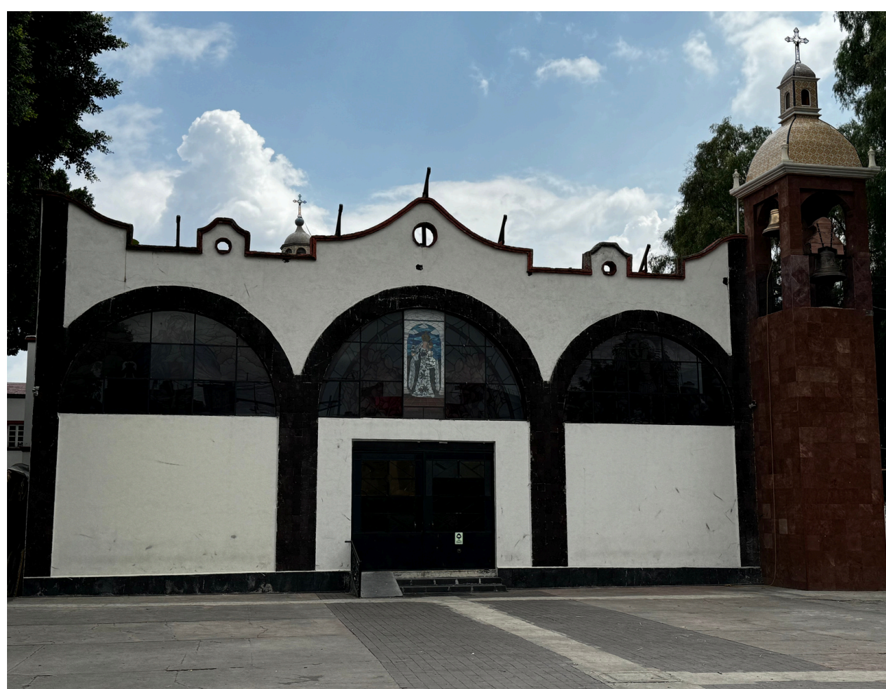
Parroquia de la Candelaria

La parroquia lleva por nombre Purificación de Nuestra Señora de la Candelaria se ubica en la calle de las Flores entre la calle Santa Cruz y Emiliano Zapata. El templo original es del siglo XVI con dimensiones pequeñas parecidas al templo de La Conchita, Coyoacán. Se piensa que este primer templo religioso del pueblo de La Candelaria fue construido como capilla abierta o de “indios” ya que este fue reconocido por la corona española como población indígena en 1567. (Aceves, 1988).