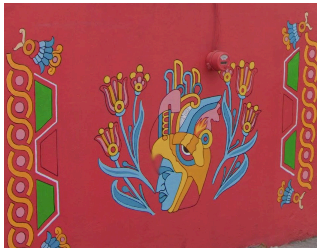
Fragmento del mural “Flores para la raza”

Cabe destacar que al caminar por las calles angostas del pueblo podrás encontrar otros murales que evocan raíces prehispánicas y religiosas con imágenes de la Virgen de Guadalupe.