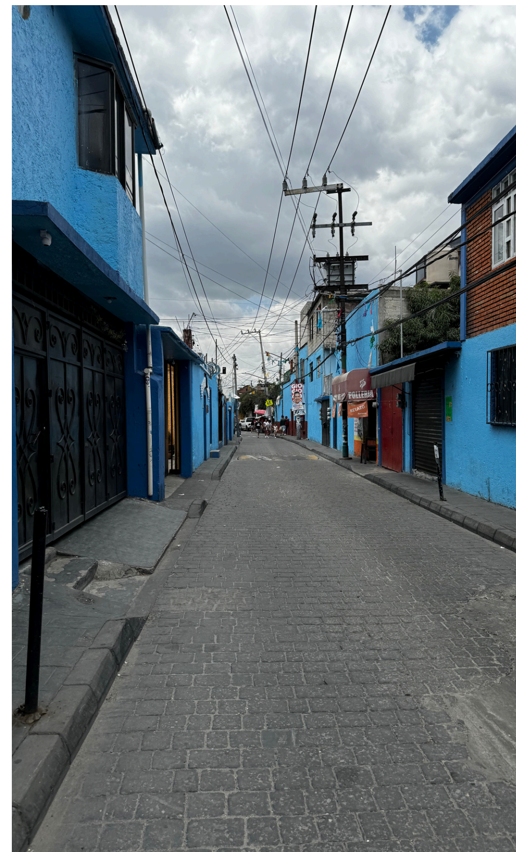
Calles del Pueblo de la Candelaria

La traza del Pueblo de La Candelaria es la mezcla de un pasado ancestral y un proceso de acelerada urbanización, ya que el pueblo quedó delimitado por dos ejes viales como División del Norte y Eje 10 (Aztecas), mientras que al interior la traza conserva sus irregularidades del terreno a través de un trazo de plato roto que permite la existencia de callejones como: Atenco, Cerrito, La Gloria, Olivo y Tepexpan.