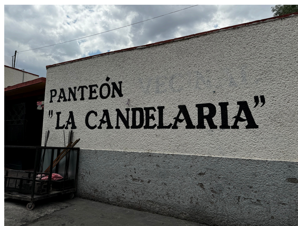
Panteón de la Candelaria

El panteón queda a espaldas de la parroquia y se accede por la calle Avenida del Panteón. Este espacio es comunitario, es decir los gestionan los pobladores y sólo pueden estar los restos de personas originarias del pueblo.