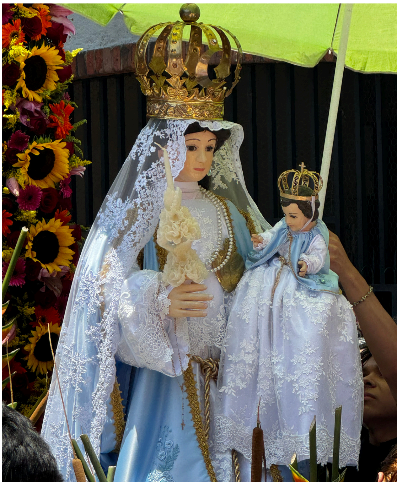
Virgen de la Candelaria en una procesión.