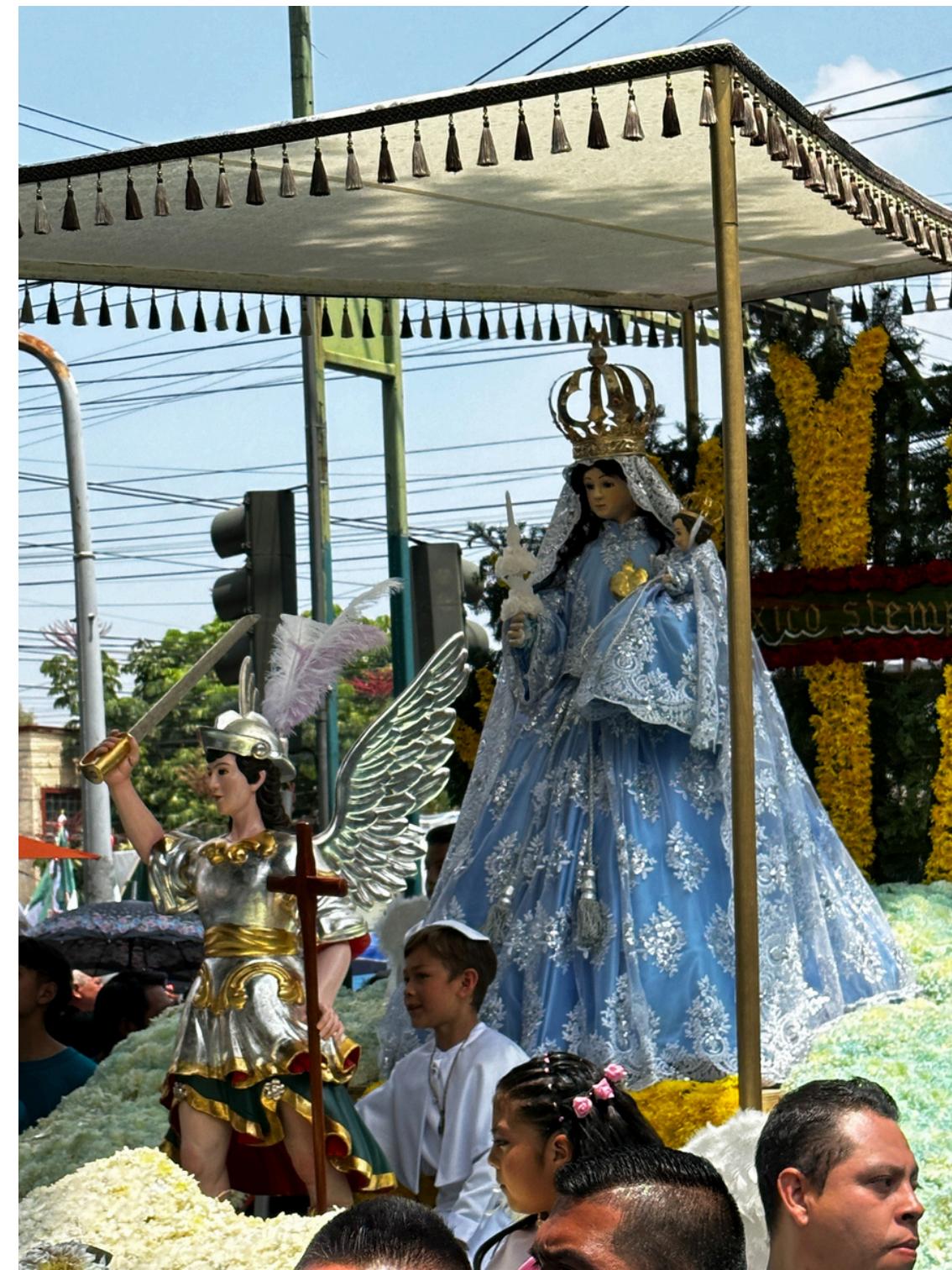
Virgen de la Candelaria durante la entrega del Sr. de la Misericordia

En tiempos prehispánicos en este territorio se veneraba a Chalchiuhtlicue, deidad femenina del agua, patrona de zanjas, ríos, lagos y, por lo regular, de aguas dulces. Con el proceso de evangelización La Virgen de la Candelaria suplió a esa deidad y por eso en su vestido se encuentra el color azul adornado con flores. De hecho, la fiesta del dos de febrero inicia con una danza como parte del sincretismo entre lo prehispánico y lo católico.