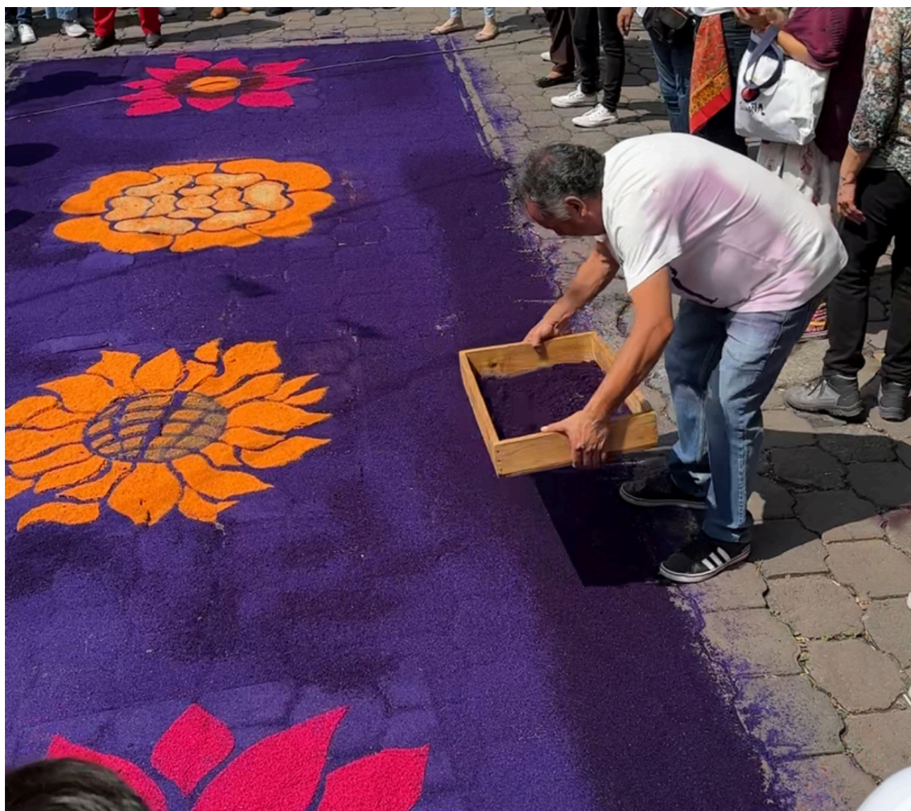
Elaboración de tapetes de aserrín

A su vez hay investigaciones que hablan sobre la elaboración de las portadas y las andas que se realizan en las festividades patronales en dicha actividad se ve el trabajo de la comunidad en su conjunto.