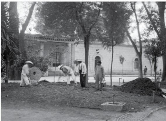
El tlachtemalácatl de Coyoacán en la década de 1930 en el Jardín Hidalgo.

Una fotografía de los archivos Casasola muestra que el marcador fue exhibido en la plaza Hidalgo hacia la década de 1930. Posteriormente, durante la remodelación de la plaza en los años setenta, el marcador estuvo en los jardines del Foro Cultural Coyoacanense y, finalmente, en la Casa de Cultura Jesús Reyes Heróles.