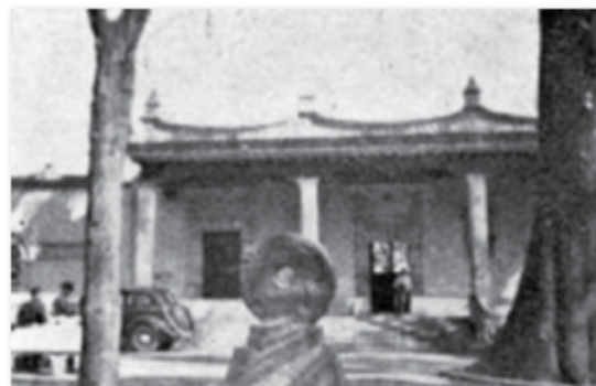
El tlachtemalácatl de Coyoacán en la década de 1940 en el Jardín Hidalgo. Fotografía publicada por Cossío (1942, fig. 8). CORTESÍA: FUNDACIÓN ALFREDO HARP HELD

El marcador es una talla en basalto que mide 80 cm de diámetro y cuya abertura interna tiene 19 cm de diámetro. En ambas caras del disco presenta bajorrelieves no del todo nítidos, los cuales han sido interpretados por diversos estudios mediante distintas técnicas de iluminación. Estas observaciones permiten distinguir la figura masculina de un individuo tendido boca arriba y decapitado. El personaje viste un faldellín triangular, braguero y sandalias con talonera, además de portar una nariguera tubular de piedra, muñequeras y ajorcas bajo las rodillas. De manera reveladora, lleva una insignia de mazorcas en la base de la espalda y parece sujetar otra con una de sus manos.